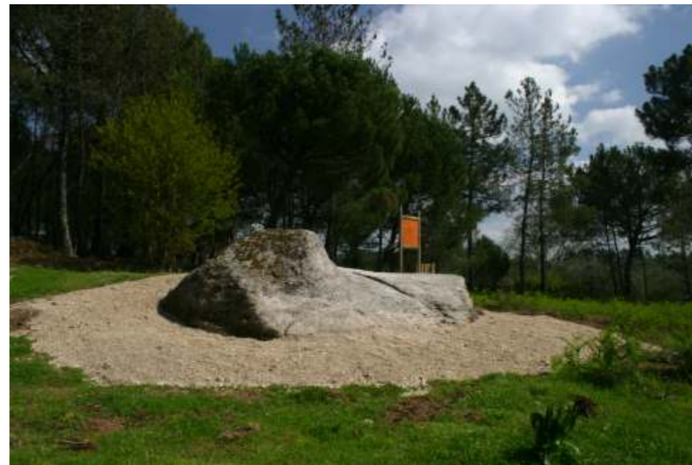
▲ Lajinha da Tapada.

Correspondendo a um amplo espaço de preservação de memória pelo conjunto de testemunhos histórico-patrimoniais que o integram, pretende-se que este circuito se traduza, dada a sua dimensão pedagógica e didáctica, numa mais-valia para a comunidade escolar local e, por outro lado, constitua um factor de atracção turística e de fruição cultural para todos os tipos de público que o queiram visitar.