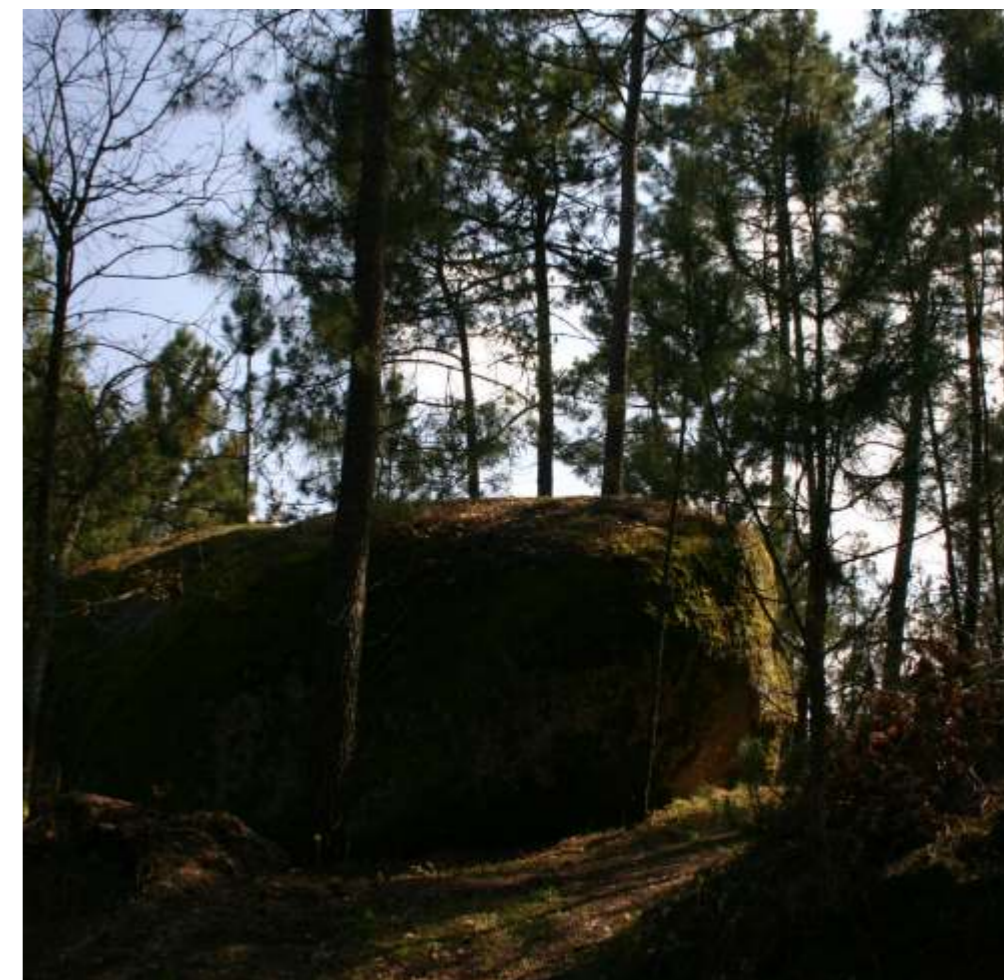
▼ Sítio arqueológico do Passal.

Esta iniciativa de valorização patrimonial contemplou vários testemunhos de ocupação humana, designadamente os vestígios de arte rupestre do Penedo da Cova da Moira e Lajinha da Tapada, cuja cronologia poderá remontar a um período indeterminado da Idade do Bronze. Do Período Romano foram tidos em conta os marcos miliários anepígrafos de Vale Touro que ainda poderão estar posicionados no antigo troço viário romano que seguia para Currelos. Prosseguindo-se aquele espaço de visita foram ainda contemplados, o local da lendária Torre Medieval de Casal da Torre, o Sítio Arqueológico do Passal e os túmulos rupestres de Albergaria, Amieiro, Cova da Moira e Cumeadas que correspondem aos testemunhos mais significativos de práticas funerárias da Época Medieval, tendo, finalmente, sido ainda, integrados neste percurso, os monumentos às Alminhas da Tapada e do Amieiro, cuja cronologia remontará a meados do Século XVIII.