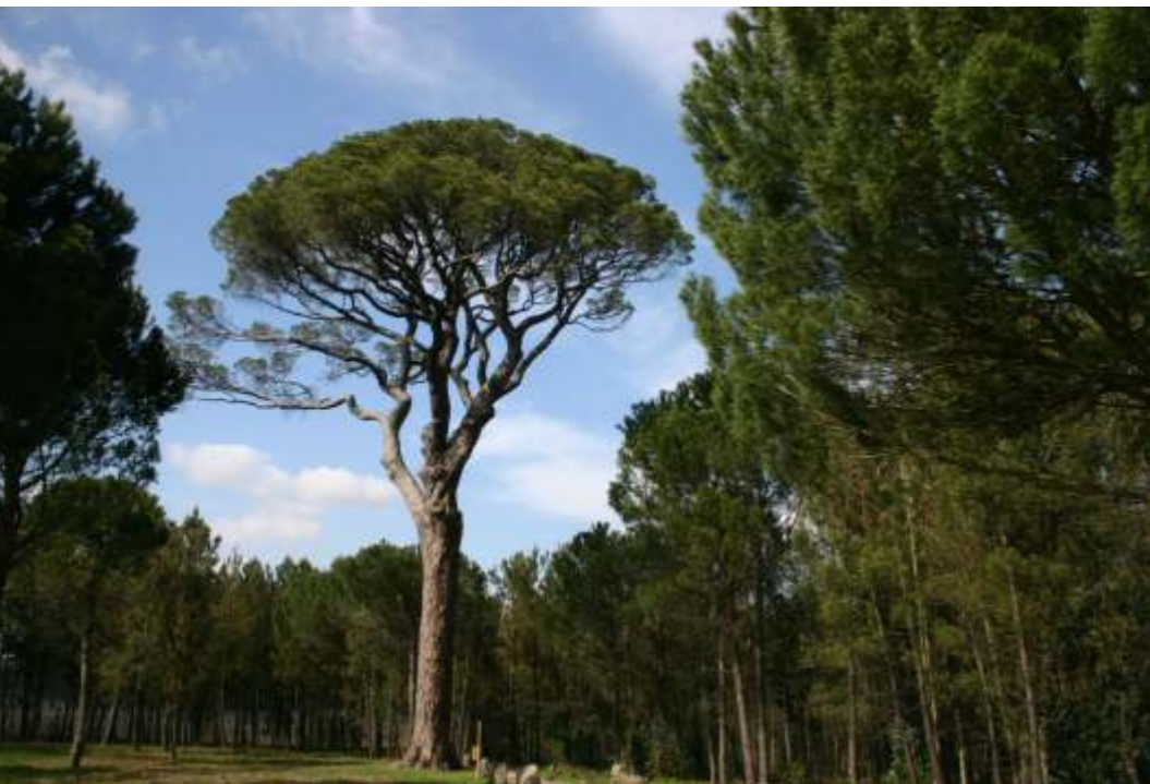
▼ Pinheiro secular do Amieiro.

Esperamos que esta iniciativa para a defesa e valorização do património concelhio tenha contribuído não só para um melhor conhecimento do passado histórico local como também para o desenvolvimento de uma educação patrimonial junto dos jovens e da comunidade em geral.