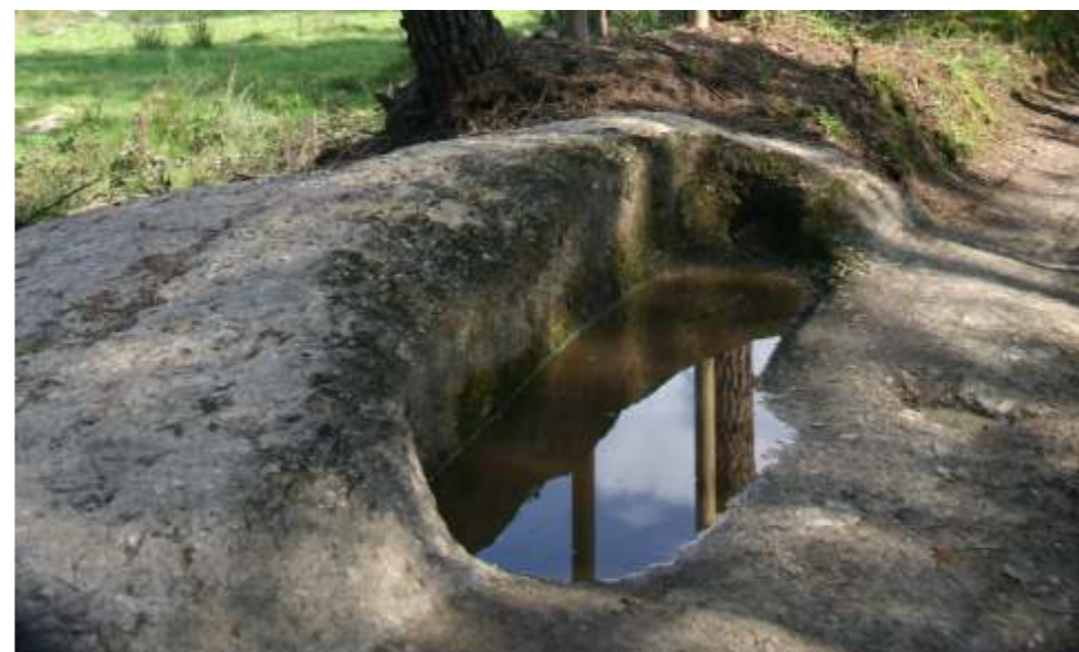
▼ Sepultura do Amieiro.

Esta iniciativa de valorização patrimonial contemplou vários testemunhos de ocupação humana, designadamente os vestígios de arte rupestre do Penedo da Cova da Moira e Lajinha da Tapada, cuja cronologia poderá remontar a um período indeterminado da Idade do Bronze. Do Período Romano foram tidos em conta os marcos miliários anepígrafos de Vale Touro que ainda poderão estar posicionados no antigo troço viário romano que seguia para Currelos. Prosseguindo-se aquele espaço de visita foram ainda contemplados, o local da lendária Torre Medieval de Casal da Torre, o Sítio Arqueológico do Passal e os túmulos rupestres de Albergaria, Amieiro, Cova da Moira e Cumeadas que correspondem aos testemunhos mais significativos de práticas funerárias da Época Medieval, tendo, finalmente, sido ainda, integrados neste percurso, os monumentos às Alminhas da Tapada e do Amieiro, cuja cronologia remontará a meados do Século XVIII.