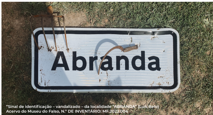
“Sinal de identificação – vandalizado – da localidade “ABRANDA” (Luís Belo) Acervo do Museu do Falso, N.º DE INVENTÁRIO: MF.2022.004

O Museu do Falso é um Museu de Território, composto exclusivamente por um acervo proveniente de criadores e agentes contemporâneos, cada trabalhando na sua área directa de especialidade e competência, subordinando as suas criações/contribuições à premissa e conceito de “Simulacro”: E se um determinado evento tivesse ocorrido de modo diverso ao que efectivamente se verificou?